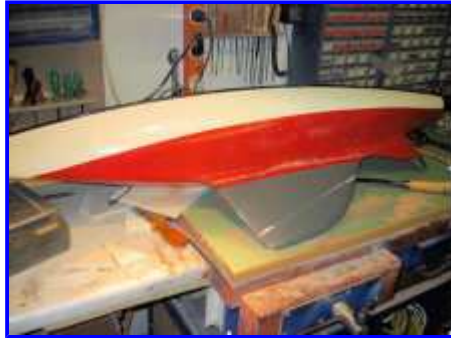
E-Bay Zustand vorher ...

entfernt und 2 neue 6mm Gewindestifte in den Kiel mit Epoxy eingegossen und dann in der (für uns) richtigen Lage mit dem Rumpf verbunden. Die Trennstelle habe ich dann mit Polyester Spachtel aufgefüllt und die Rundung zum Rumpf mit einem Suppenlöffel ausgefüllt und geglättet. Nun hatte die Yacht wieder ihr normales Aussehen. Den ges. Kiel habe ich dann mit Epoxy Harz überzogen und nach der Trockenzeit wieder geschliffen. Den Innenraum des Schiffes habe ich nochmals mit Epoxy Harz gestrichen um ihn absolut wasserdicht zu bekommen. Nun konnte ich endlich beginnen aus dem Entlein einen schönen weißen Schwan zu bauen.