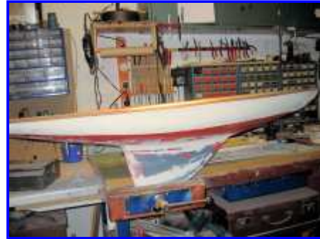
... nach dem Drehen des Kiels