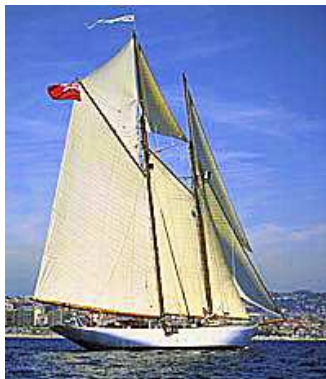
Classic Gaff Schooner Altair off the coast of Nice, Cote de Azur, Mediterranean, France. Chris Cameron 1998 (verlinkt)

Der hellste Stern aus dem Dreieck Adler-Aquila-Eagle ist Altair, der Namensgeber der Yacht, seine Nachbarn sind Deneb und Wega. Die 1889 von William Fife III gebaute "Dragon" erhielt erstmals den goldenen Schmuckstreifen mit dem Drachenkopf. Dies ist seitdem das Erkennungszeichen aller Fife-Yachten.